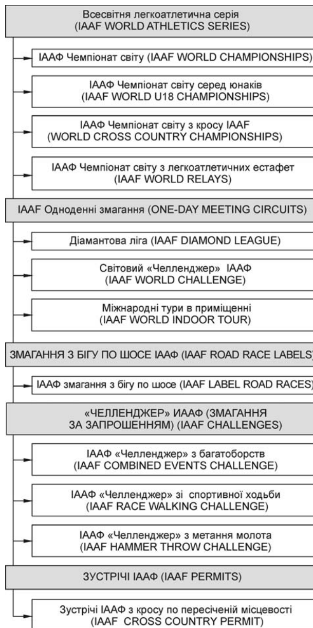
Рисунок 2 – Змагання з легкої атлетики в календарі ІААФ у 2017 р.

За класифікацією Міжнародної асоціації легкоатлетичних федерацій змагання ІААФ включають п'ять груп: Всесвітню легкоатлетичну серію; одноденні змагання, змагання з бігу по шосе, «Челленджер» (змагання за запрошеннями) (рис. 2).