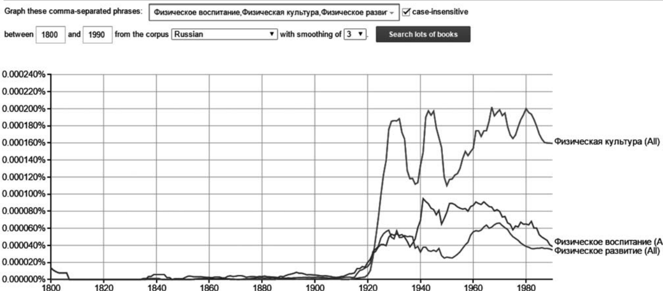
Рисунок 1 – Графік російських словоформ «фізичне виховання», «фізична культура», «фізичний розвиток»