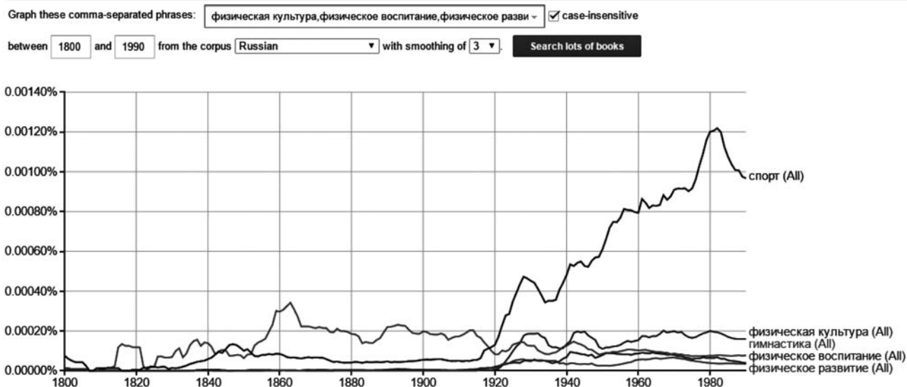
Рисунок 2 – Графік російських словоформ «фізичне виховання», «фізична культура», «фізичний розвиток», «спорт», «гімнастика»