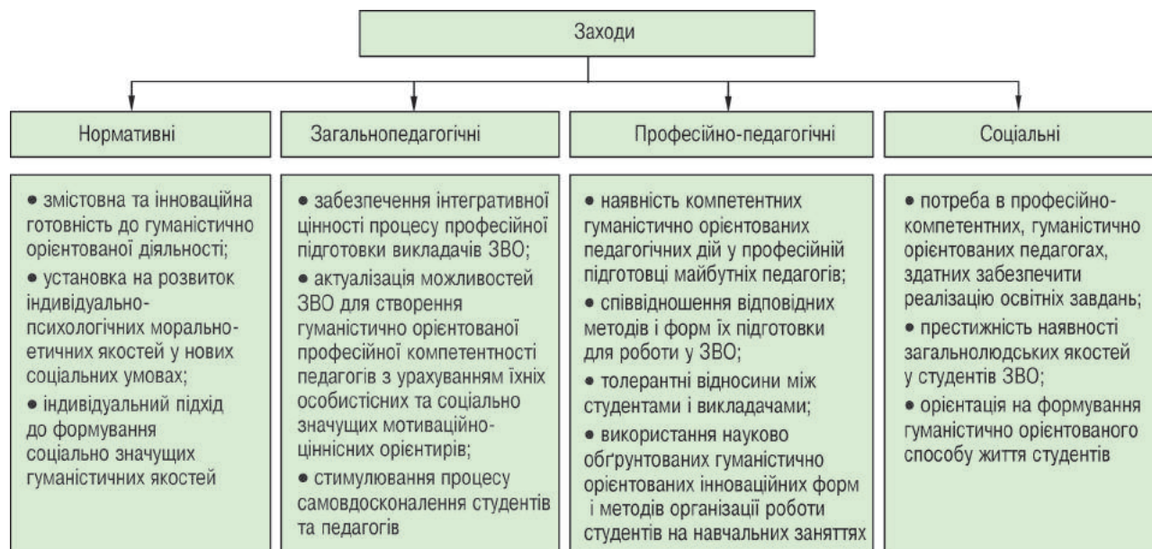
Рисунк 1 – Комплекс методичних заходів, які забезпечують досягнення студентами належного рівня розвитку загальнолюдських моральних якостей

власні судження, думки, погляди, ідеї тощо.