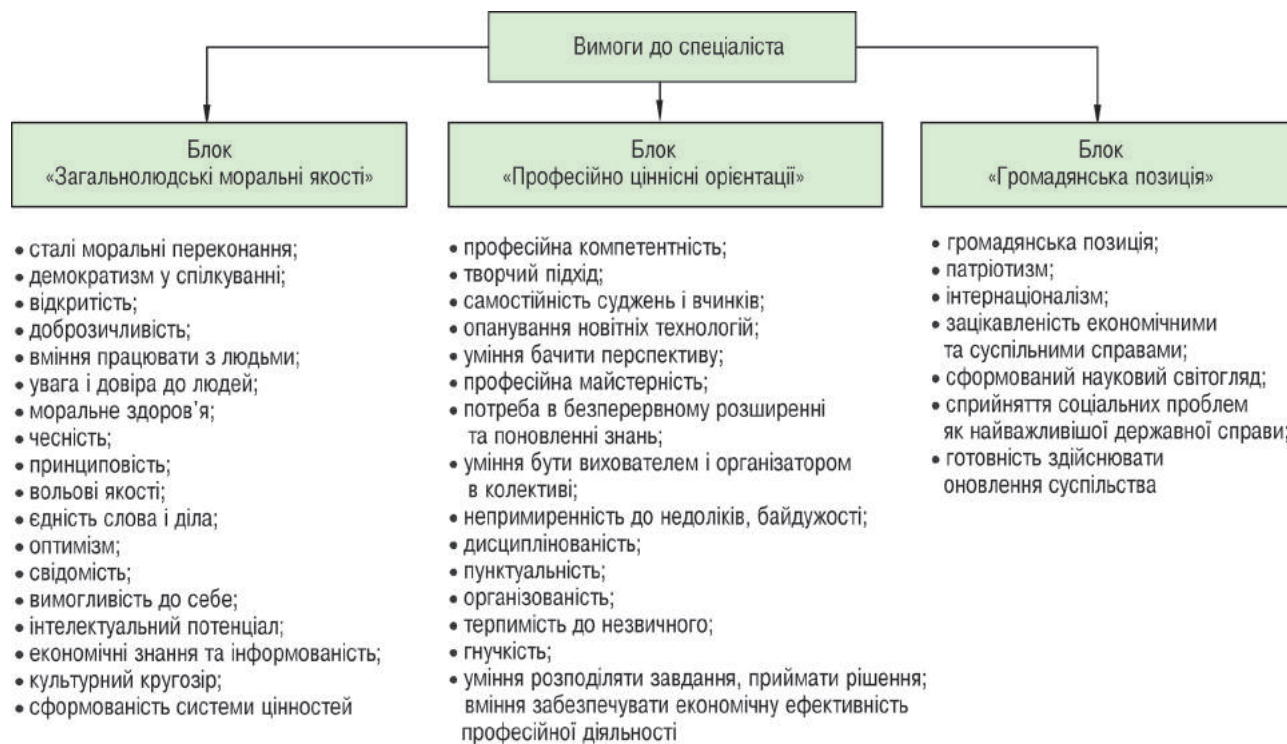
Рисунок 5 – Блоки професіограми спеціаліста сфери фізичної культури і спорту з урахуванням гуманістичної спрямованості фахової освіти

Сьогодні навчання у ЗВО не завжди чинить помітний вплив на світогляд, перебудову свідомості студентів, формування їхніх переконань, установок, ціннісних орієнтацій на створення гуманістичного підґрунтя розвитку сучасного суспільства. Зазвичай гуманістично орієнтована особистість формується у процесі виховання в родині, спілкування з найближчим оточенням, в освітніх закладах, під впливом засобів масової інформа-