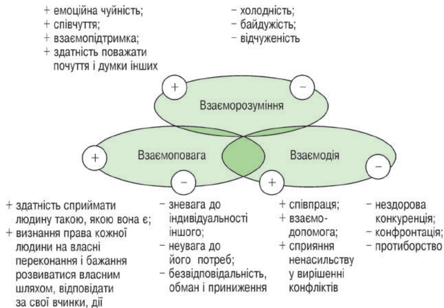
Рисунок 4 – Складові гуманності, що визначають характер стосунків між людьми

З огляду на зазначене, гуманізація процесу підготовки фахівців сфери фізичної культури та спорту полягає у ставленні педагога до студентів як до особистостей зі своїми індивідуальними властивостями, прихильністю, вимогами та системою цінностей. Свої стосунки учасники гуманістично оріє-