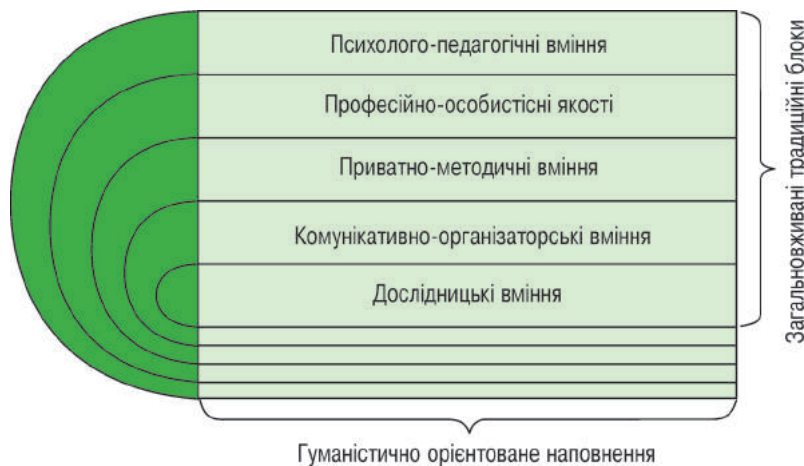
Рисунок 3 – Основні складові професіограми спеціаліста сфери фізичної культури і спорту

цесу з урахуванням морально-етичної складової фахового рівня викладачів, наявність у них умінь, навичок та наполегливості у впровадженні соціально-гуманістичної діяльності у ЗВО.