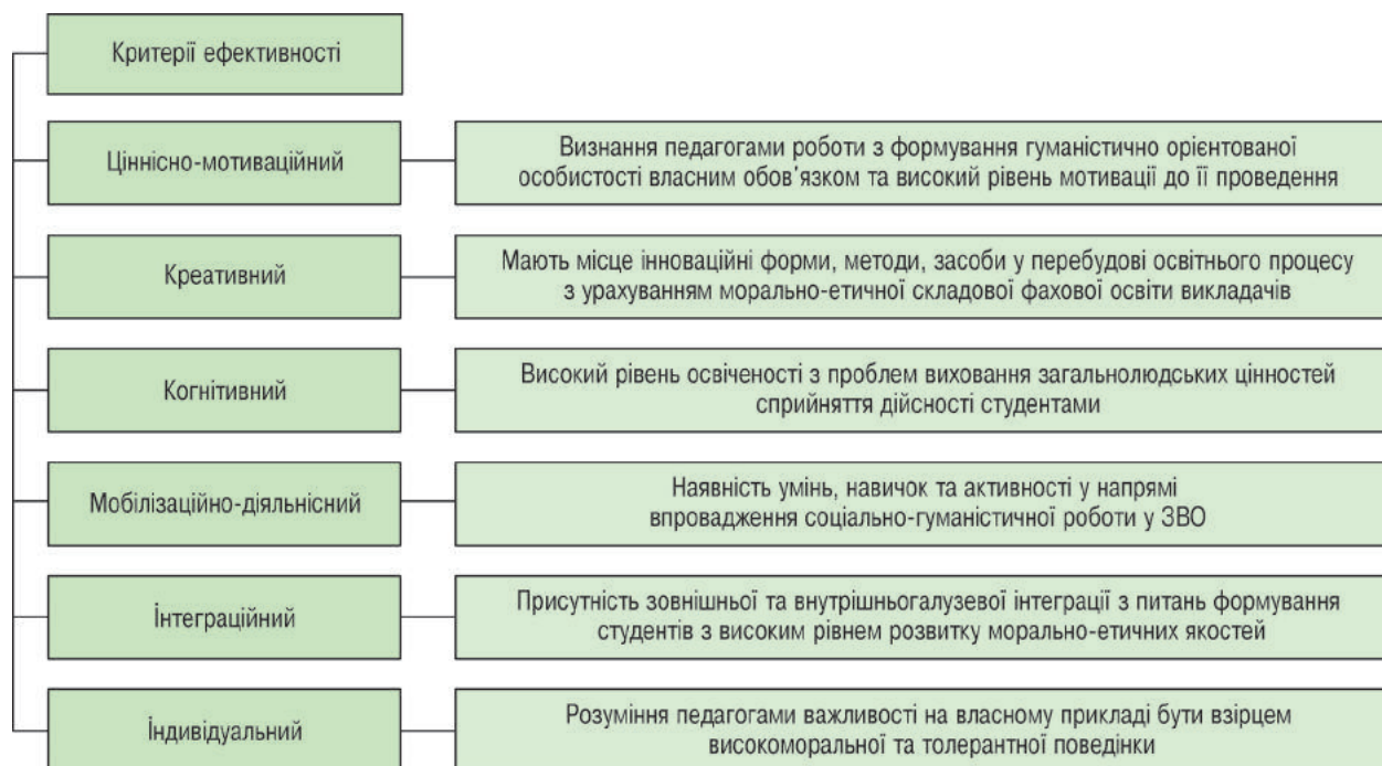
Рисунок 2 – Критерії ефективності гуманістично орієнтованої роботи педагогів у закладах вищої освіти