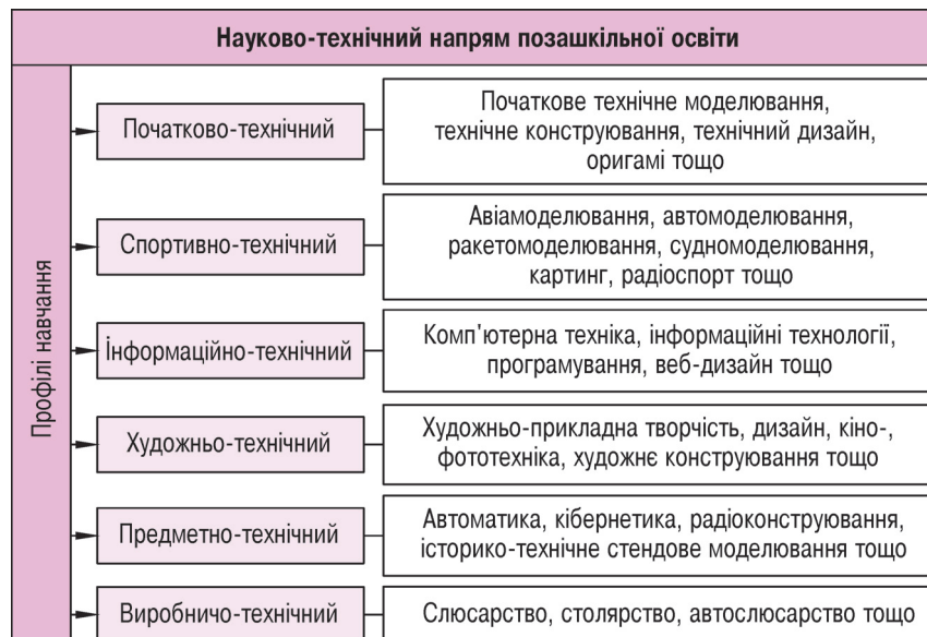
Рисунок 1 – Місце спортивно-технічних видів спорту у структурі науково-технічного напрямку позашкільної освіти за профілями навчання [1]

Результати дослідження та їх обговорення. Фізичне виховання дітей та учнівської молоді за межами школи здійснюється закладами позашкільної освіти спортивного профілю: дитячо-юнацькими спортивними школами (ДЮСШ), спеціалізованими дитячо-юнацькими школами олімпійського резерву (СДЮШОР), спеціалізованими дитячо-юнацькими школами паралімпійського резерву