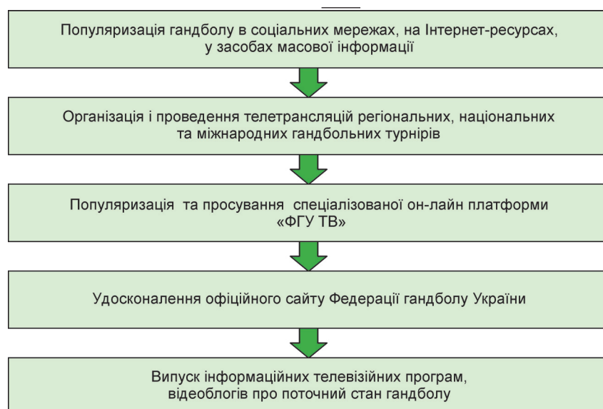
Рисунок 3 – Алгоритм створення єдиної інформаційної політики з популяризації гандболу в Україні

національних збірних команд України до основних міжнародних змагань (рис. 2); розробку програм підготовки спортсменів на основі застосування сучасних знань і методик спортивного тренування, медицини, біології та інформаційного забезпечення (рис. 3) [3, 10–12].