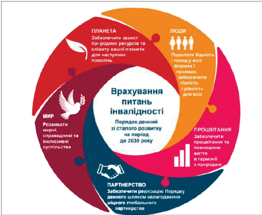
Рисунок 2 – Врахування питань інвалідності на порядку денному зі сталого розвитку ООН (за даними Національної Асамблеї людей з інвалідністю України)

люди з ВРР мають можливість вести активний здоровий і повноцінний спосіб життя.