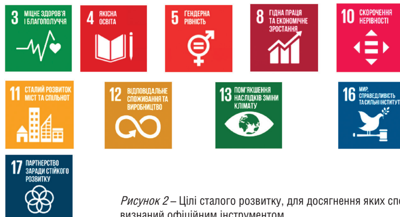
Рисунок 2 – Цілі сталого розвитку, для досягнення яких спорт визнаний офіційним інструментом

глобальному, національному та місцевому рівнях.