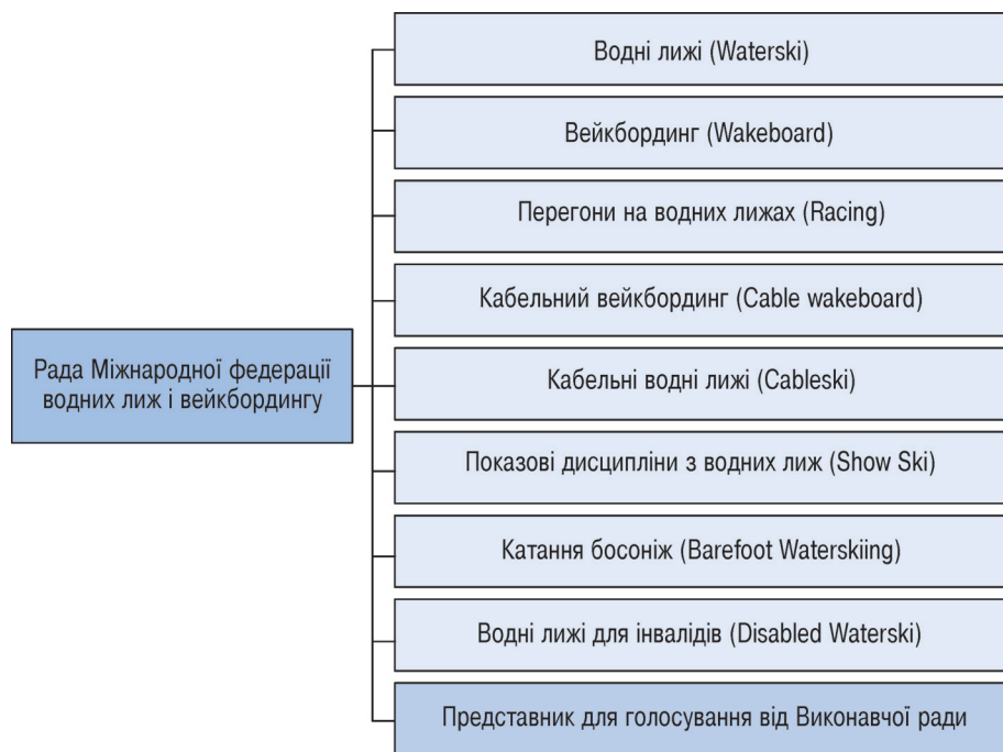
Рисунок 2 – Структура Ради Міжнародної федерації водних лиж і вейкбордінгу

Діяльність Міжнародної федерації водних лиж і вейкбордінгу сьогодні спрямована на просування і розвиток буксирувальних водних видів спорту шляхом роботи з національними федераціями. Серед напрямів роботи нами визначено: