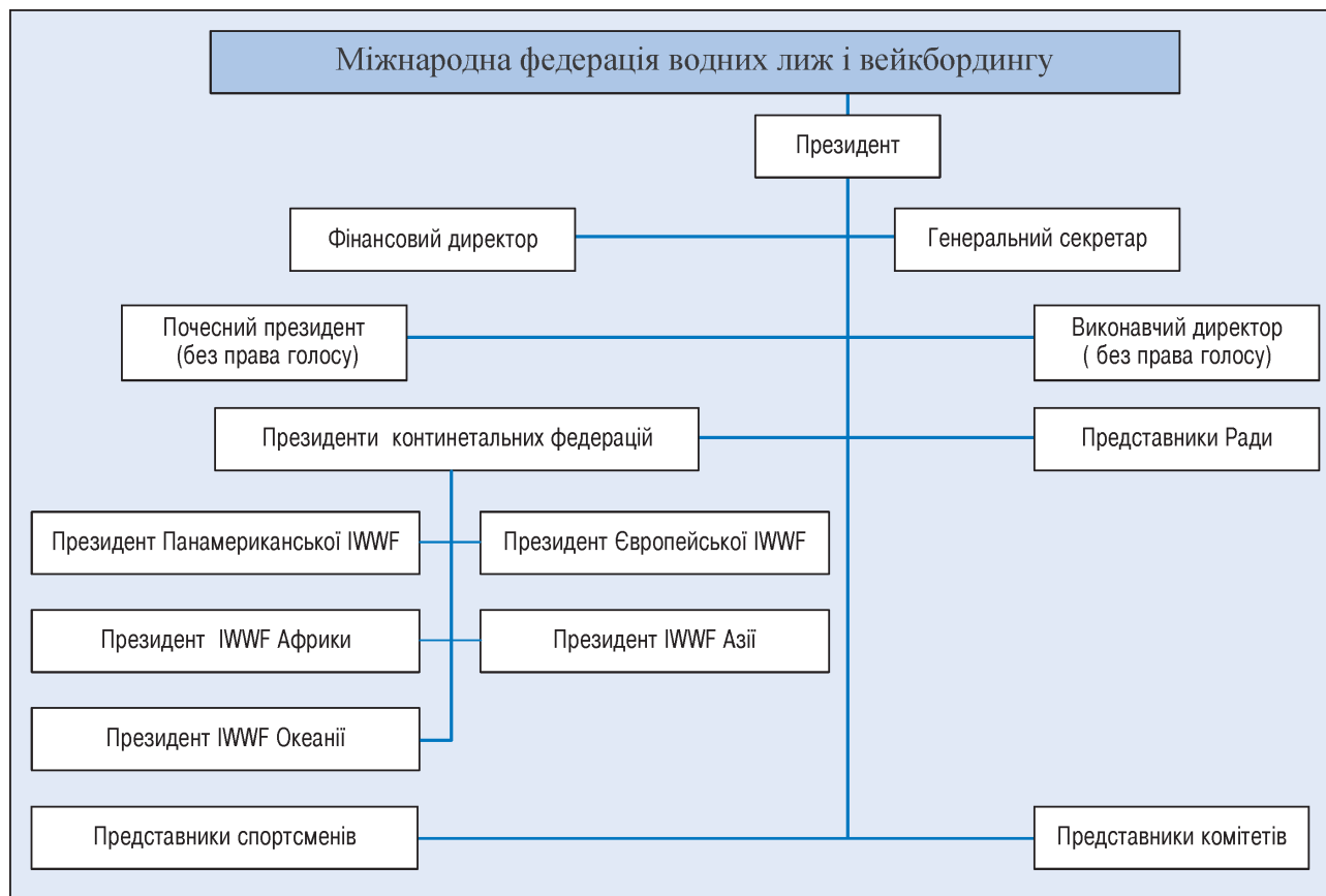
Рисунок 1 – Організаційна структура управління буксирувальними водними видами спорту та вейкбордингом у світі

Вона включає дев'ять спортивних дисциплін, серед яких вейкбординг, кабельний вейкбординг, кабельні водні лижі, вейксерфінг.