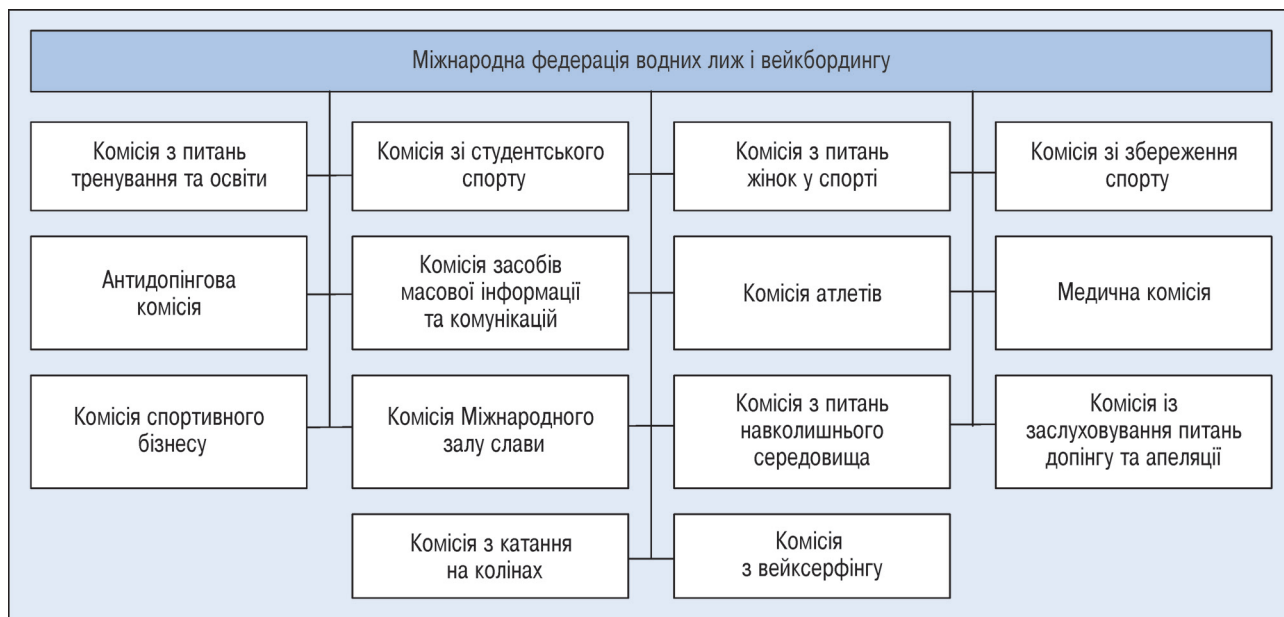
Рисунок 3 – Комісії в структурі Міжнародної федерації водних лиж і вейкбордингу