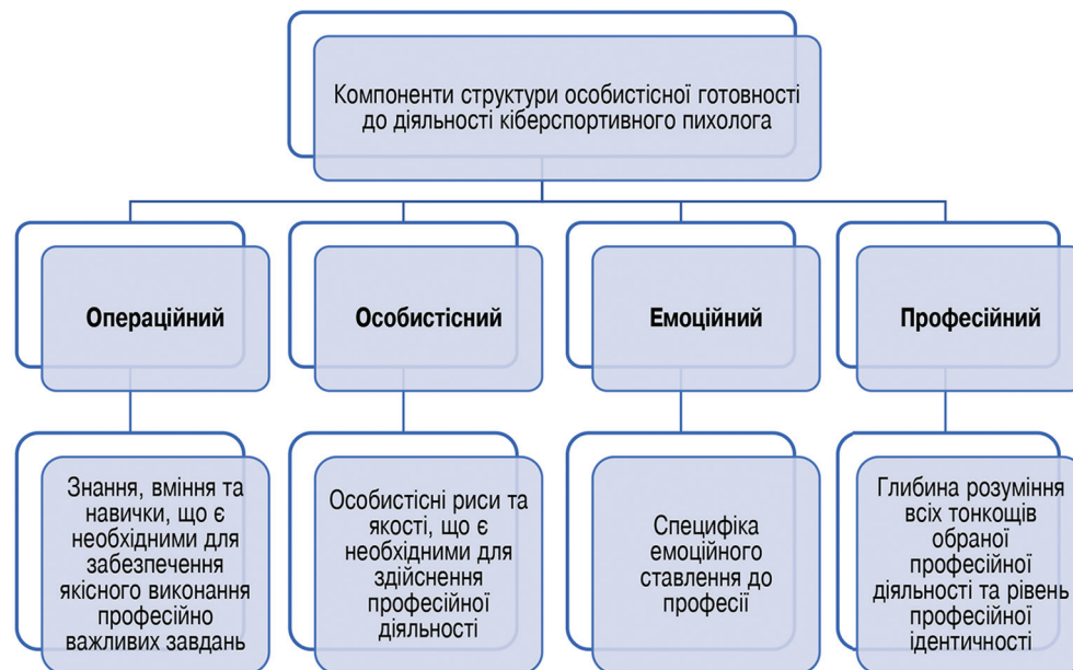
Рисунок 2 – Компоненти структури особистісної готовності до діяльності кіберспортивного психолога

чають мотиваційну складову, комплекс професійних дій діагностичного, розвиваючого, формуючого, терапевтичного, коригуючого та консультативного характеру, способи компенсації власних вад. Знання спортивним психологом спільних рис, особливостей і конкретики своєї професійної діяльності, структури, змісту і практики є необхідною передумовою її успішного здійснення.