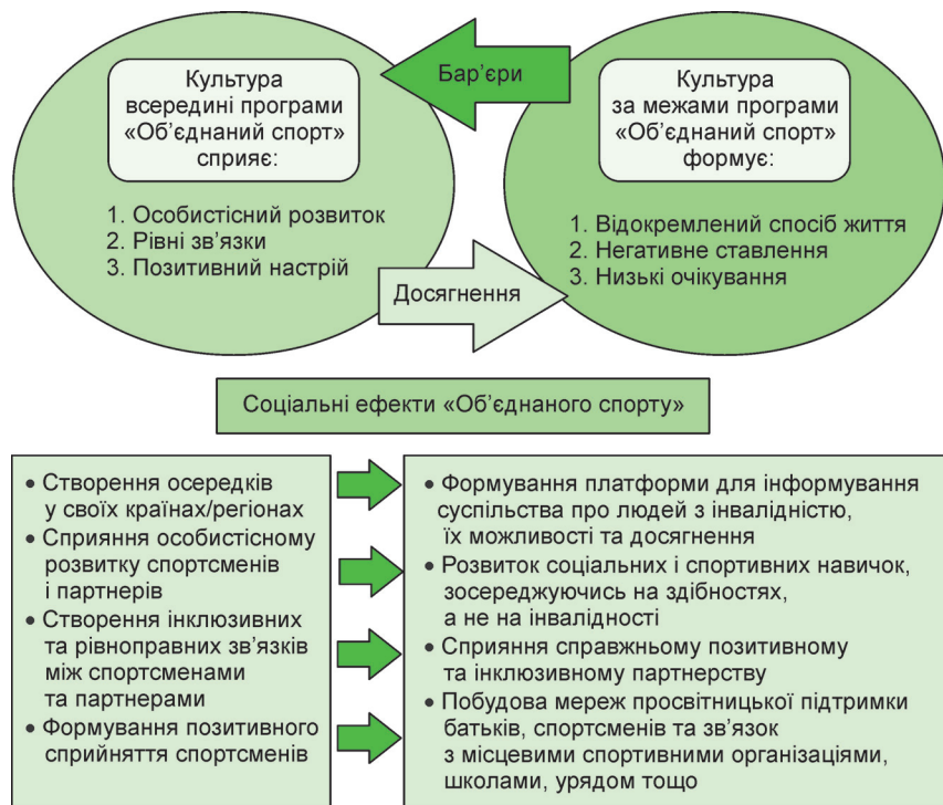
Рисунок 3 – Основні досягнення і бар'єри, які долають люди з відхиленнями розумового розвитку за допомогою програми «Об'єднаний спорт»

Отже, волонтерська програма Спеціальних Олімпіад «Об'єднаний спорт» сприяє формуванню важливих соціальних навичок для спортсменів