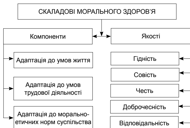
Рисунок 1 – Складові морального здоров'я

циплінованості як однієї з важливих особистісних якостей громадянина (Круцевич, 2008) [6]. Але слід зазначити, що патріотизм і мораль – це не одне і те ж саме. Мораль виступає регулятором поведінки, межею, яку людина не може перетнути навіть під тиском суспільства чи загрозою свого життя та для її підтримки необхідні вольові якості (совість). Патріотизм – це фактор, що впливає на поведінку людини, але, на відміну від моралі, патріотизм потребує наявності предметів та образів поклоніння (герби, прапори, штандарт, місто, країна, селище, сподади та інше), а його рівень патріотизму залежить від подій, які стосуються всієї країни, регіону, а не окремих особистостей.